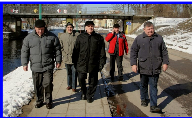
Marszobieg po zebraniu ?!.. do „Szarej czapli”